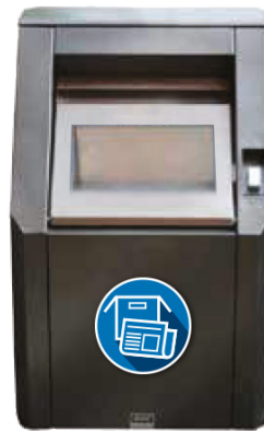
Einwurf für Papier