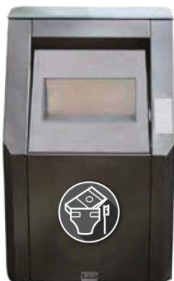
Einwurf für Restabfälle