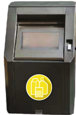
Einwurf für Leichtverpackungen