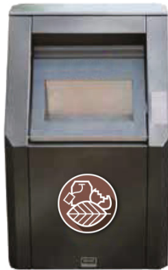
Einwurf für Bioabfälle